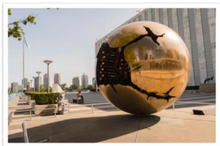
Changing Mindsets in Public Institutions to Implement the 2030 Agenda for Sustainable Development

El conjunto de herramientas está organizado en torno a cinco grupos temáticos, desde establecer el escenario para comprender la importancia de cambiar la mentalidad y analizar el papel de los servidores públicos en el logro de los ODS hasta la exploración de varias mentalidades (colaboración, aprendizaje y liderazgo), estrategias y tácticas para promover nuevas formas de pensar. Se exploran mentalidades y habilidades. El conjunto de ejercicios, lecturas seleccionadas, autoevaluación y actividades grupales están diseñados para ayudar a los participantes a comprender los vínculos entre mentalidades, innovación y cómo los cambios en las culturas y valores individuales, organizacionales e institucionales pueden apoyar la prestación de servicios